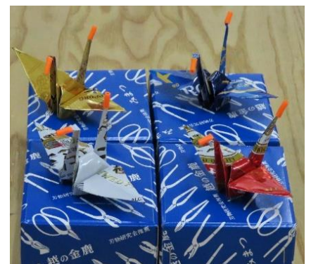
豊島区立小学校6年生の作品