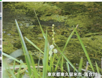
東京都東久留米市・落合川