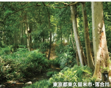
東京都東久留米市・落合川