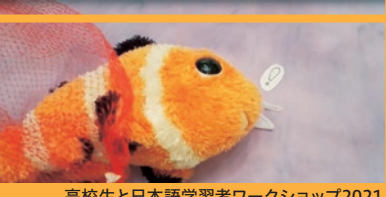
高校生と日本語学習者ワークショップ2021 参加者のメッセージアニメ